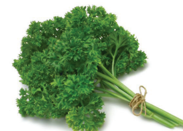
Le persil est un anti-oxydant puissant

Effet antiprolifératif et apoptotique de l'apigénine sur les cellules de glioblastome